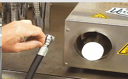
Remoção do lacre exclusivo Ultra Clean

CONHEÇA MAIS DETALHES SOBRE OS PRODUTOS NO NOSSO SITE