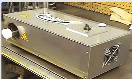
Equipamento termo retrátil de bancada

80% DE REDUÇÃO NO TEMPO GASTO COM VEDAÇÃO DE MANGUEIRAS E TUBOS